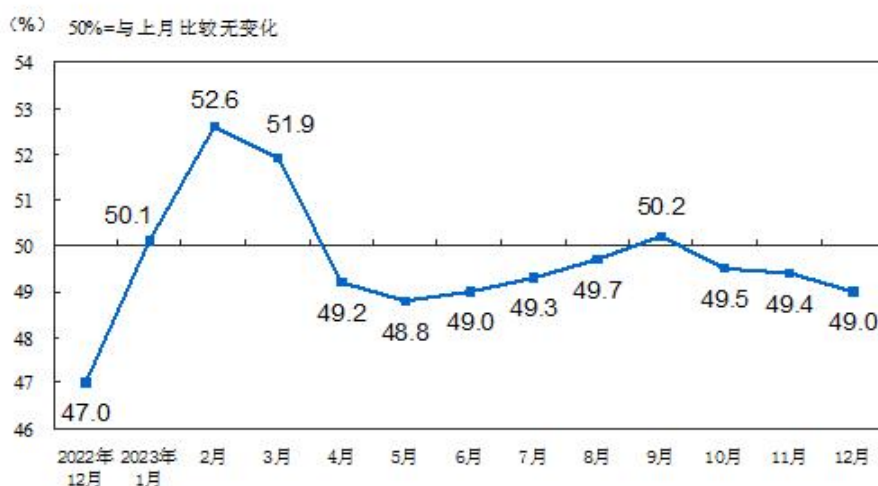
图1 制造业PMI指数（经季节调整）

国家统计局数据显示，12月份，制造业采购经理指数（PMI）为49.0%，比上月下降0.4个百分点，制造业景气水平有所回落。生产指数为50.2%，比上月下降0.5个百分点，仍高于临界点，表明制造业生产延续扩张。新订单指数为48.7%，比上月下降0.7个百分点，表明制造业市场需求有所下降。原材料库存指数为47.7%，比上月下降0.3个百分点，表明制造业主要原材料库存量减少。