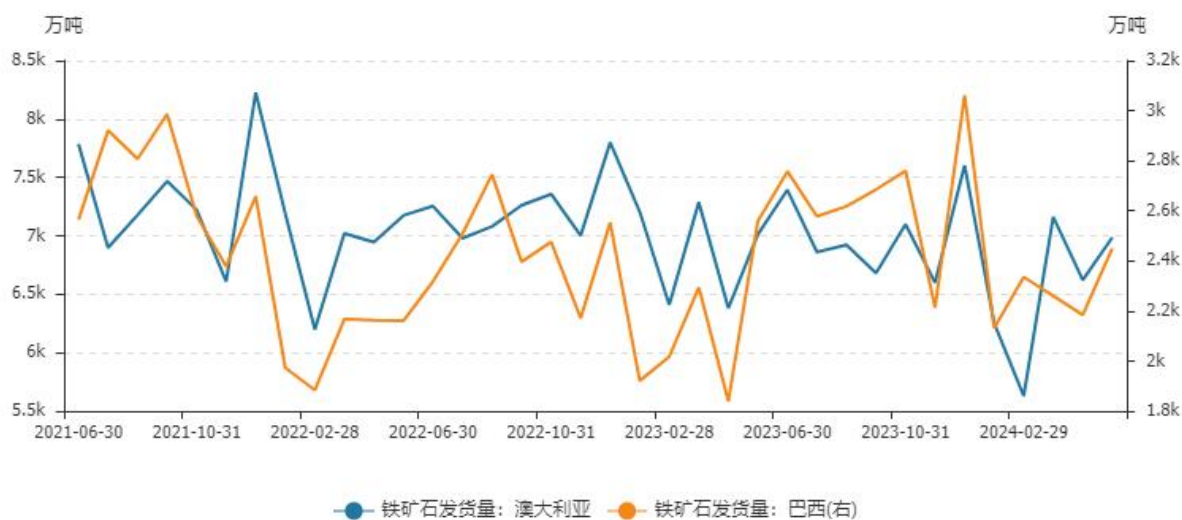
澳洲与巴西铁矿石发运量

截止至 2024 年 05 月，澳大利亚铁矿石发运量为 6,986.7 万吨，较上月增加 365.2 万吨；巴西铁矿石发运量为 2,449.8 万吨，较上半月增加 265.6 万吨。