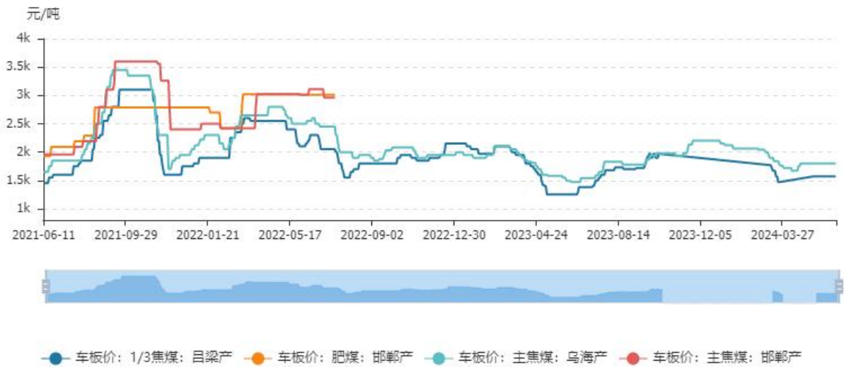
炼焦煤华北各地车板价