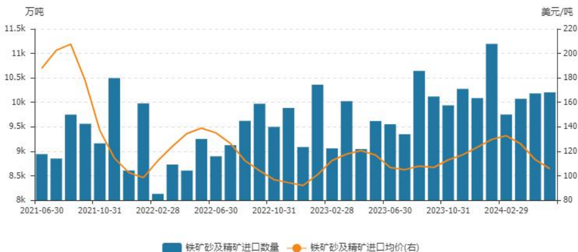
铁矿石进口数量与均价

截止至 2024 年 05 月，铁矿石及精矿进口数量为 10,203.3 万吨，较上一个月增加 21.3 万吨；铁矿石及精矿进口均价为 105.75 美元/吨，较上一个月减少 7.37 美元/吨。