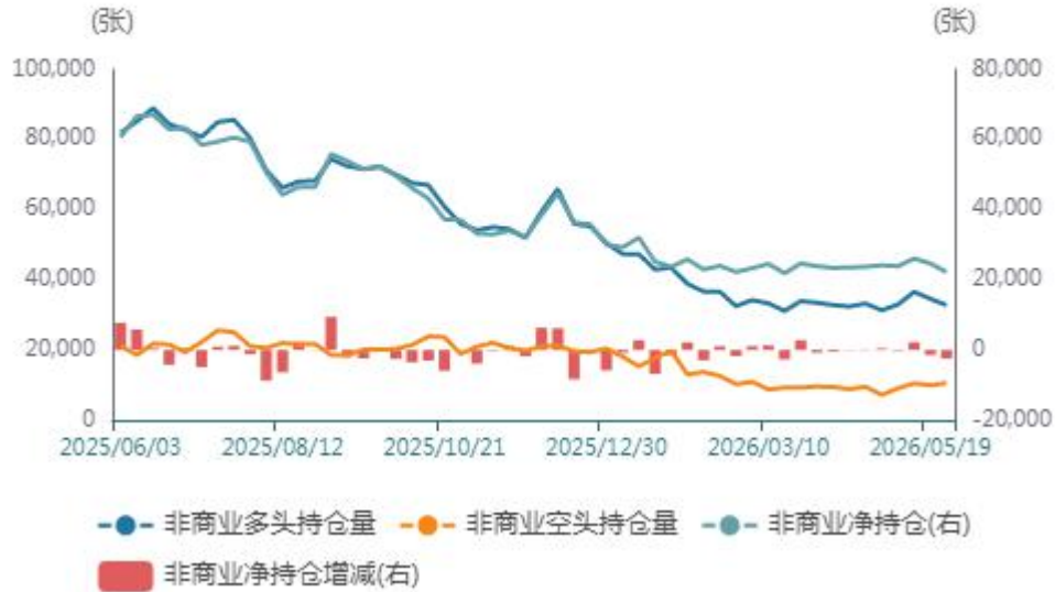
非商业持仓走势图