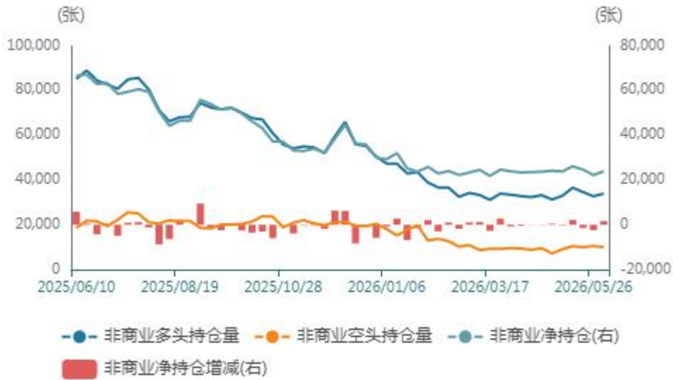
非商业持仓走势图