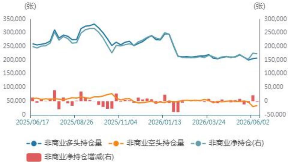
非商业持仓走势图